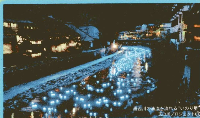
湯西川の清流を流れる「いのり星」 天の川プロジェクト®

湯西川温泉かわあかり 期間 7月25日(水) ~ 7月31日(火) 時間 20時~21時(予定) 後援 天の川プロジェクト ★期間中いのり星の放流体験 希望者募集。 詳しくは裏面をご覧ください。