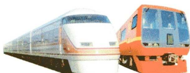
253系リニューアル車両 6月4日デビュー

JR新宿・池袋・大宮から日光・鬼怒川へ直通運転 湯西川温泉へのアクセスが便利になりました